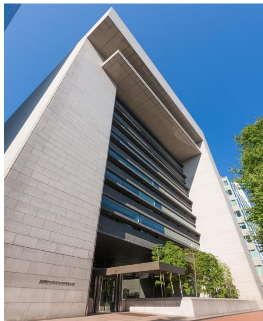
日本橋ライフサイエンスビル

東京メトロ銀座線・半蔵門線「三越前」駅A6出口より徒歩3分 JR 総武線「新日本橋」駅5番出口より徒歩2分